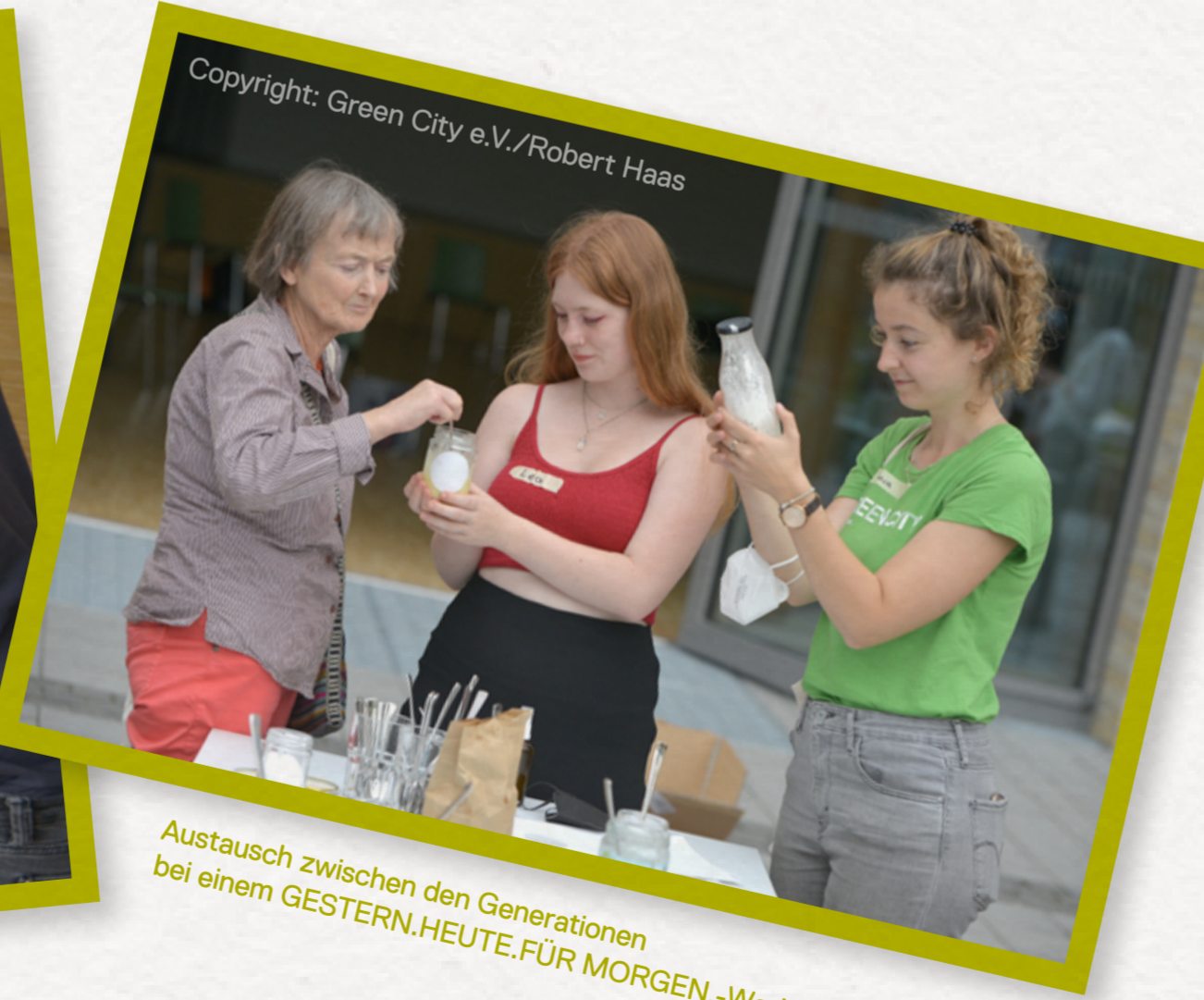
Austausch zwischen den Generationen bei einem GESTERN.HEUTE.FÜR MORGEN.-Workshop.