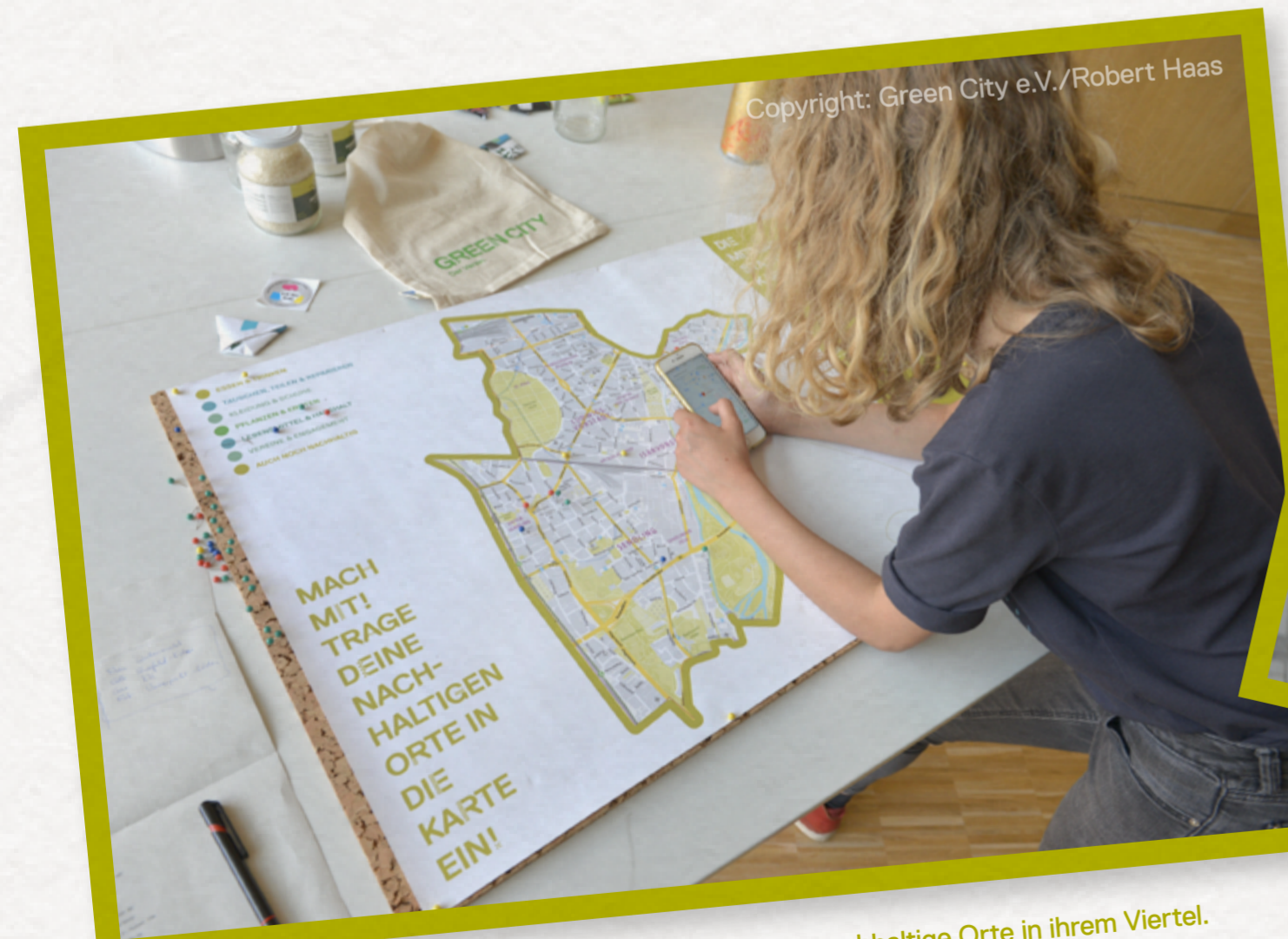
Arbeit an der Stadtteilkarte: Eine junge Teilnehmerin sucht nachhaltige Orte in ihrem Viertel.